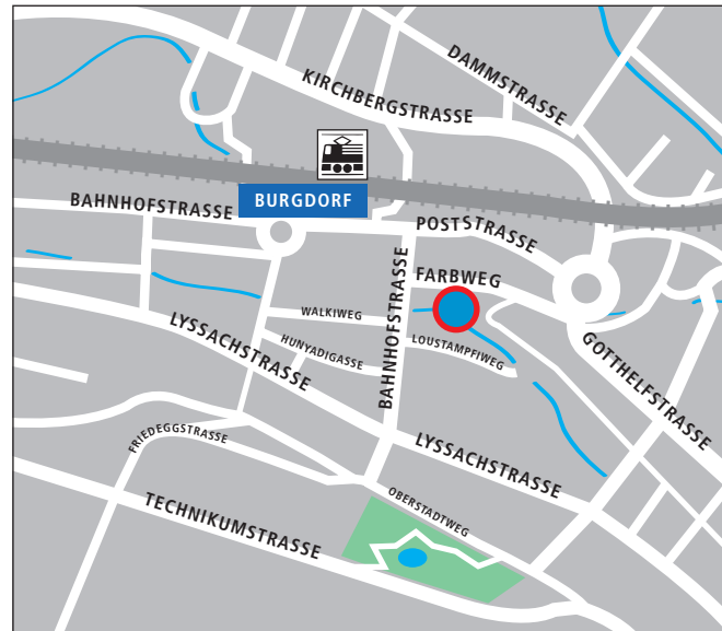
Ansprechstelle Integration Burgdorf Farbweg 11, 3400 Burgdorf, Tel. 031 310 12 72